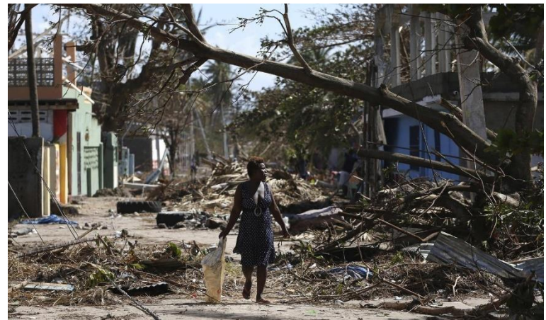
uragano Matthew, 2016